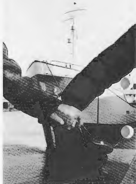
Idag är det hamnarbetarna i den danska fackföreningsrörelsen som tar de värsta stötarna mot arbetsgivare och regering.

— Det finns två skäl; dels har vi i flera år arbetat för att bygga upp soli-