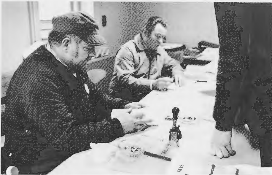
På strejkkontoret i Köpenhamn bladats strejktidningar och försäljning av stöd- märken organiseras.

pekar följt hamnarbetarna i spåren. Det gäller framför allt anställda inom fiskeindustrierna som organiseras av Kvindeligt Arbejderforbund. När detta skrivs ligger arbetet nere i en lång rad fiskeindustrier i protest mot det sänkta understödet.