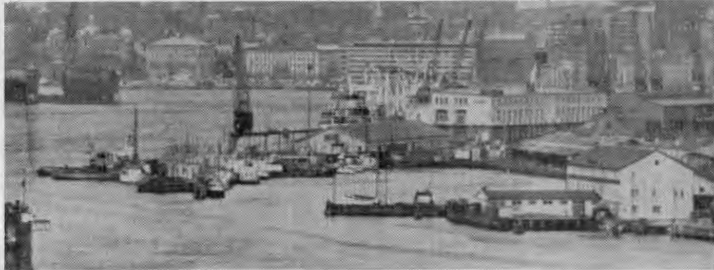
Ett avtalsbud som berör alla hamnar i Sverige — även Göteborgs — lämnades på söndagen. Då fick Transport och stuvarna slutbudet från medlingarna. Svaret måste bli ja eller nej.

Detta senare skulle gälla ca 20 procent av de svenska hamnarbetarna.